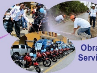
Obras y Servicios

FONO RENTAS : 581-2387 Anexo 203/204/206